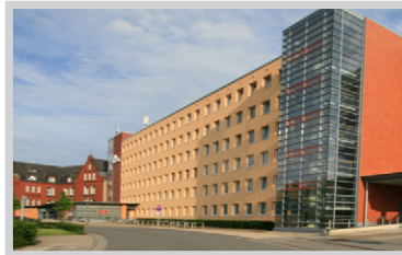
St. Johannes-Hospital, Varel