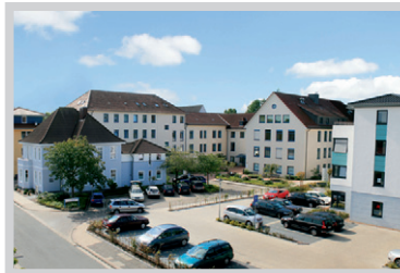
St. Bernhard-Hospital, Brake