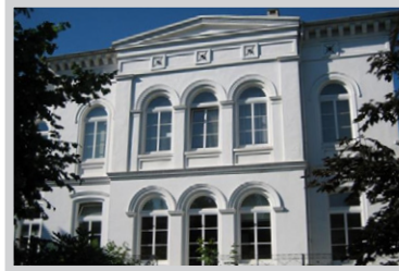
Gesundheits- und Krankenpflegeschule am St. Johannes-Hospital